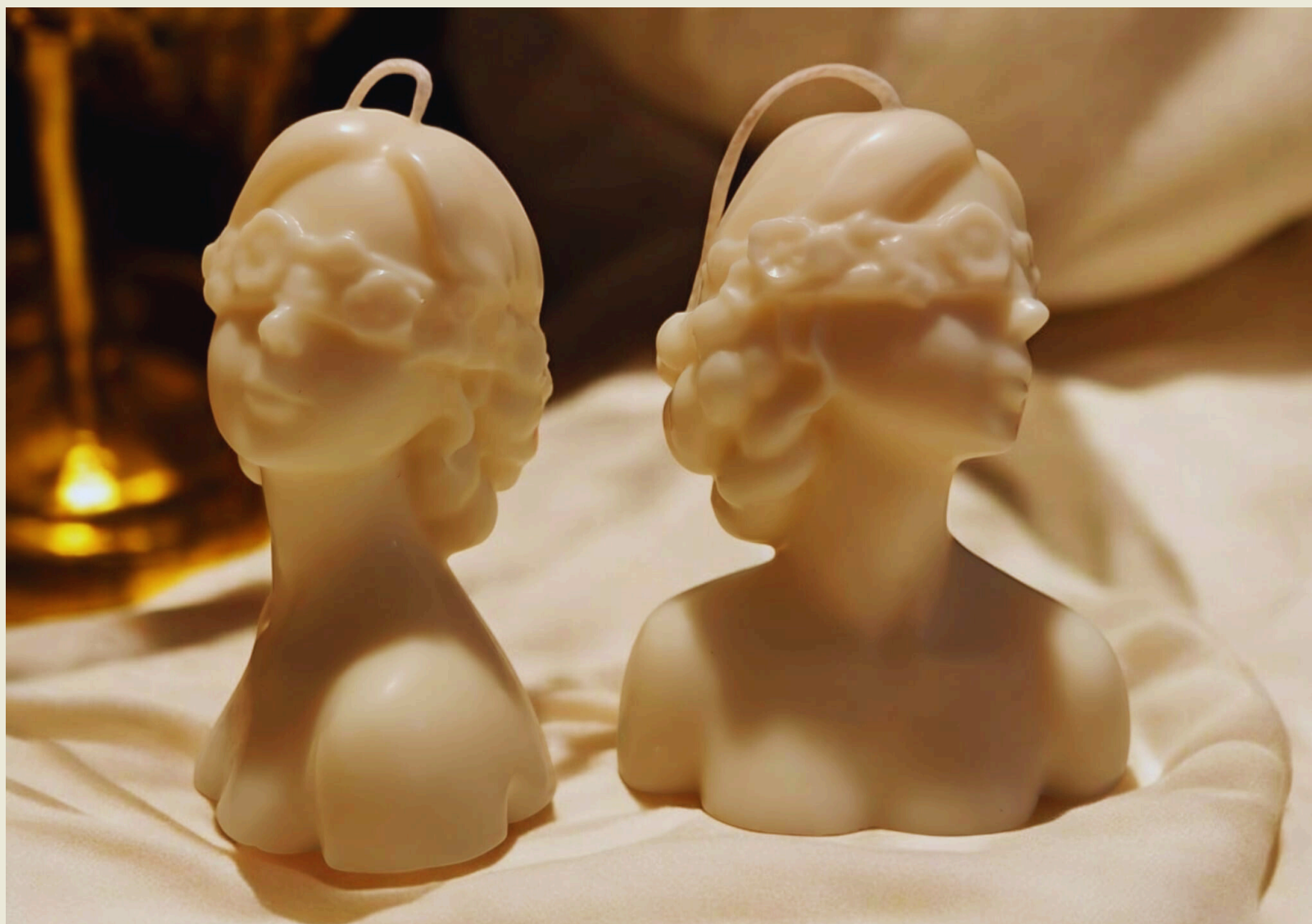
Dea Bendata 10 euro

Candela scultorea in cera di soia naturale, interamente colata a mano. Dea Bendata rappresenta la figura femminile della fortuna e del destino, con gli occhi coperti da una delicata fascia floreale.