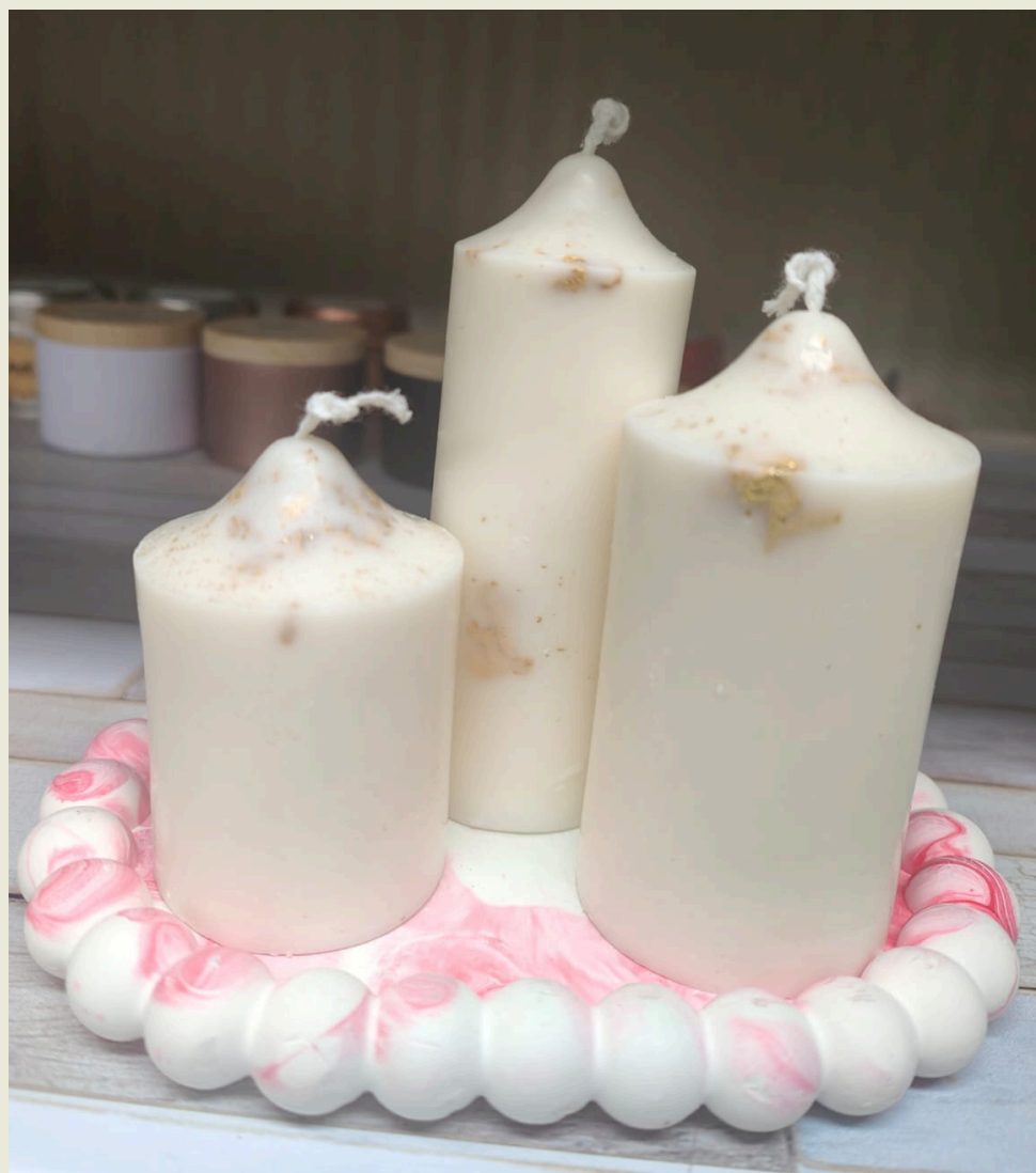
Trio di candele 30 euro

Set artigianale composto da tre candele in cera di soia naturale, colate a mano con delicate venature dorate e base decorativa in gesso ceramico effetto marmo rosa (possibilità di scegliere il colore delle sfumature).