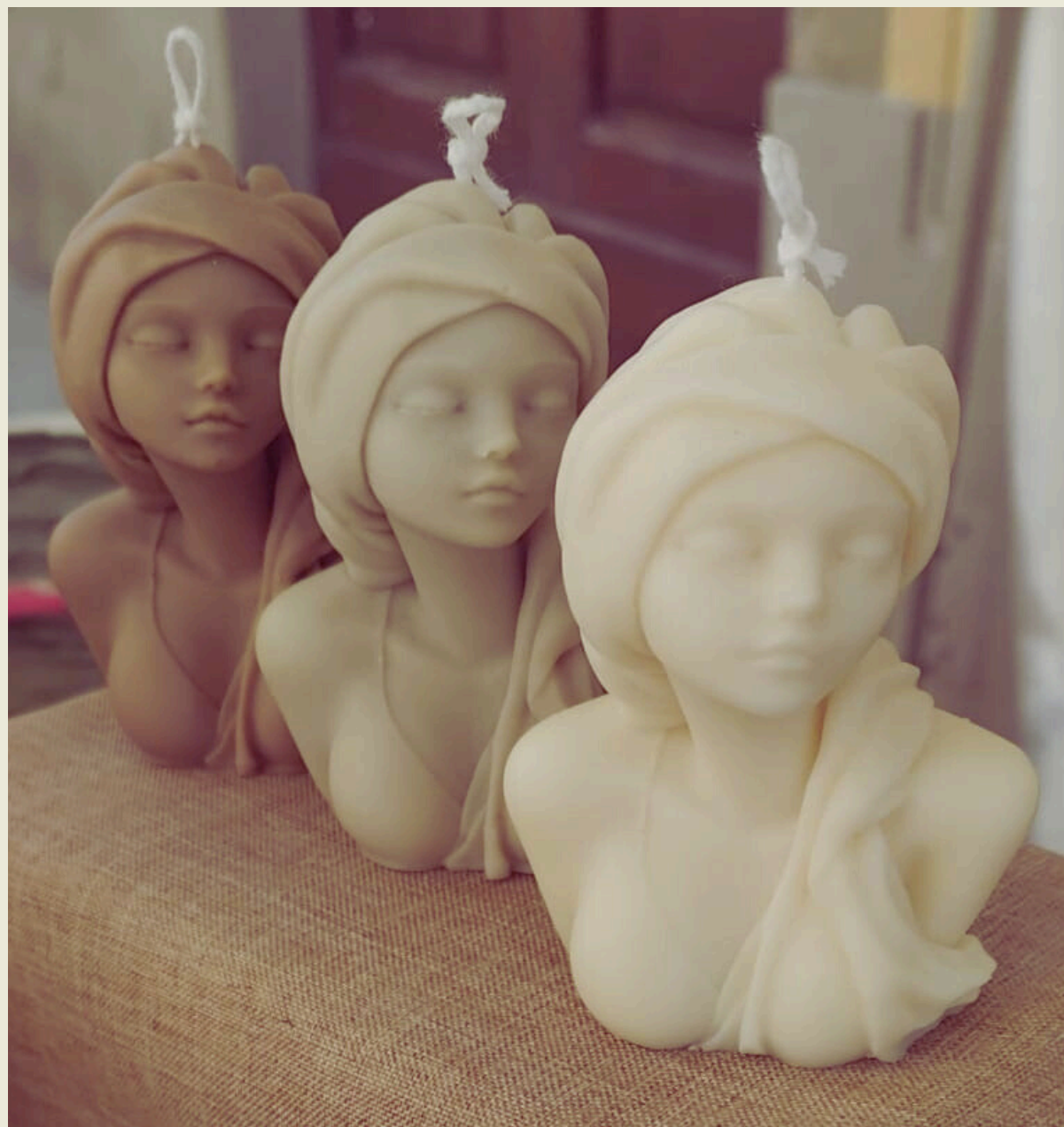
Marisa 12 euro

Candela artigianale in cera di soia naturale, colata a mano con delicatezza e armonia. Marisa raffigura una figura femminile avvolta in un turbante, simbolo di eleganza senza tempo e serenità interiore.